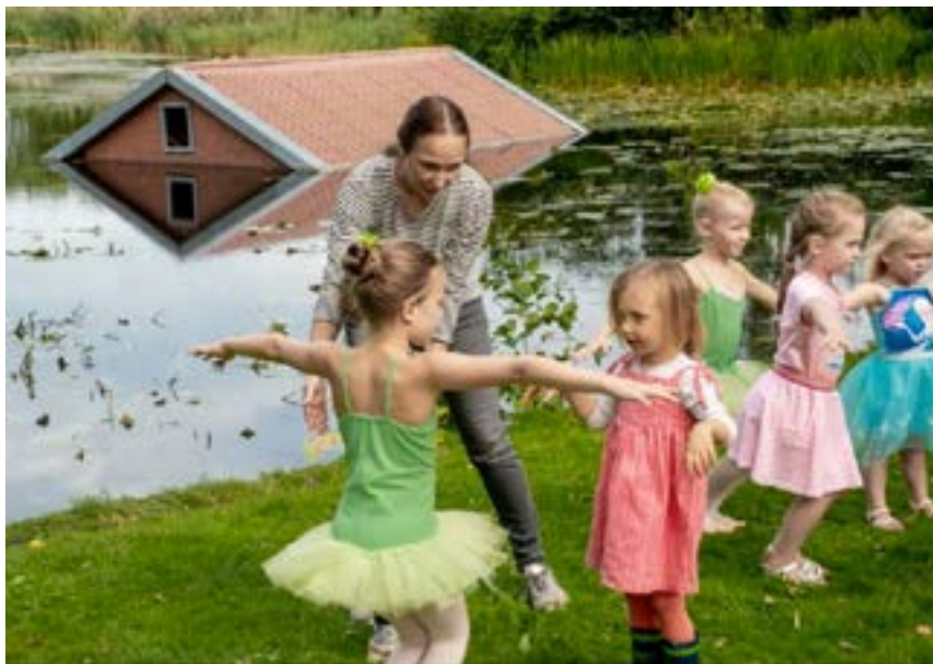
Foto: Fields of Wonder, workshop door Balletschool Giselle, more than dance tijdens het van RIJN festival