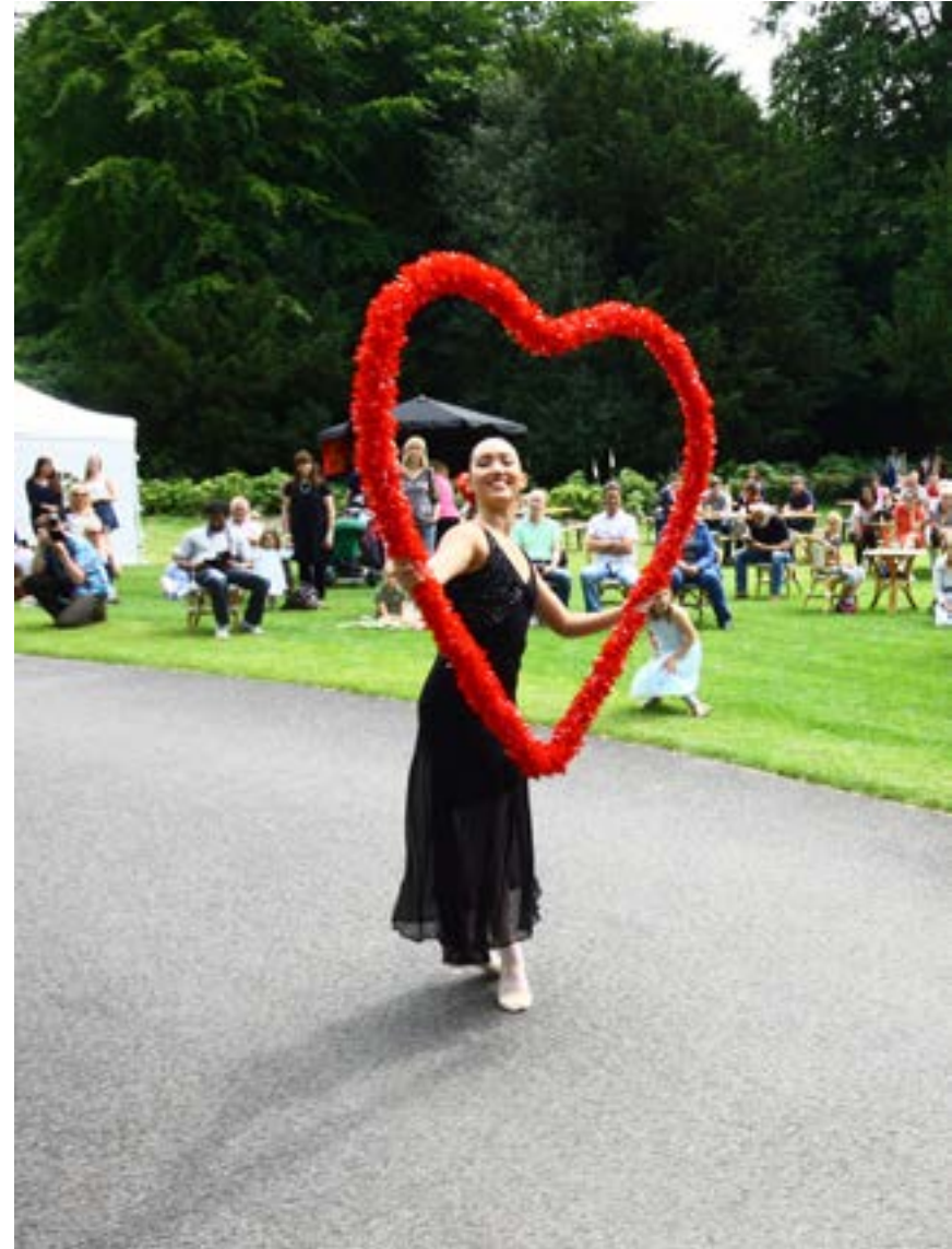
Foto: Balletstudio Giselle, more than dance, fotograaf: Renzo Versteeg

Alle deelnemers aan het cultuurnetwerk geven aan dat zij hun ledenbestand of het aantal deelnemers aan hun activiteiten willen vergroten en/of verbreden. Daarbij is expliciet behoefte aan het bereiken van nieuwe doelgroepen. Hiermee laten de culturele instellingen zien dat ze een bijdrage willen leveren aan de (culturele) diversiteit en inclusiviteit. En dat zij drempels willen slechten voor mensen die niet vanzelfsprekend met kunst en cultuur in aanraking komen. Zij zien samenwerking met maatschappelijke instellingen hierbij als een kans, evenals de verbindingen die binnen de Sterrentuin kunnen ontstaan.