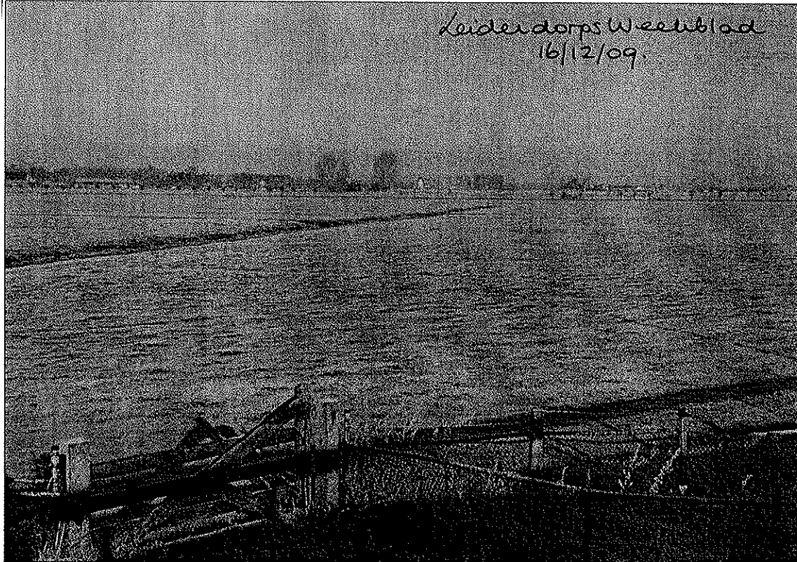
De Boterhuispolder moet in de loop van komend jaar al beter toegankelijk worden voor fietsers en wandelaars.

De vier gemeenten hebben hun afspraak vorige week woensdagmiddag in het clubgebouw van Asopos de Vliet officieel vastgelegd met de ondertekening van de ambitieverklaring 'Tussen Kagerplassen en Oude Rijn'. (Zie vervolg elders in dit blad)