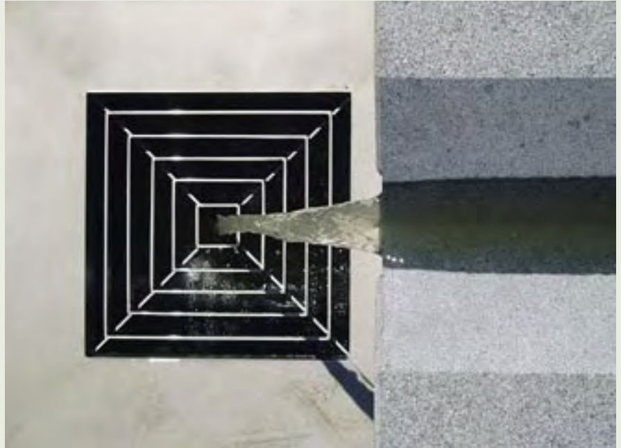
18 | Uitzicht op Arcadië | H. van Lunteren