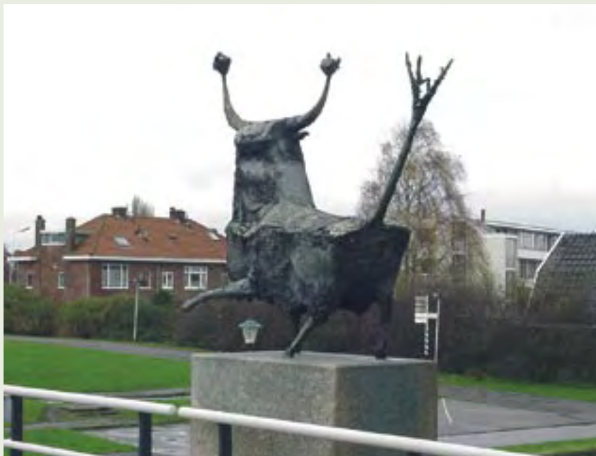
15 Beeld van een Stier | T. van der Nahmer