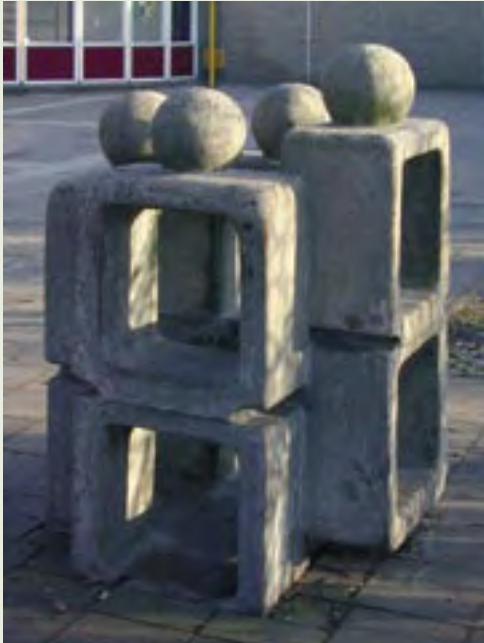
1 | Vier kinderen/personen | kunstenaar onbekend