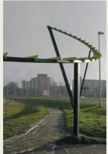
8 | Geluidsscherm | Snieder en Bouwarchitecten