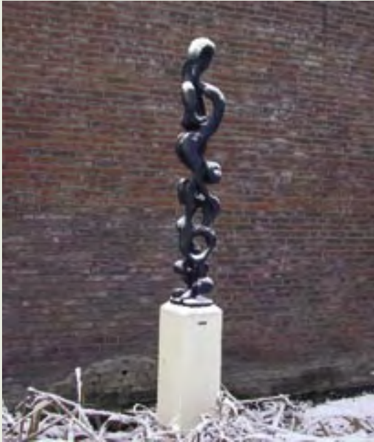
9 | Eva met de Slang | A. Kenan