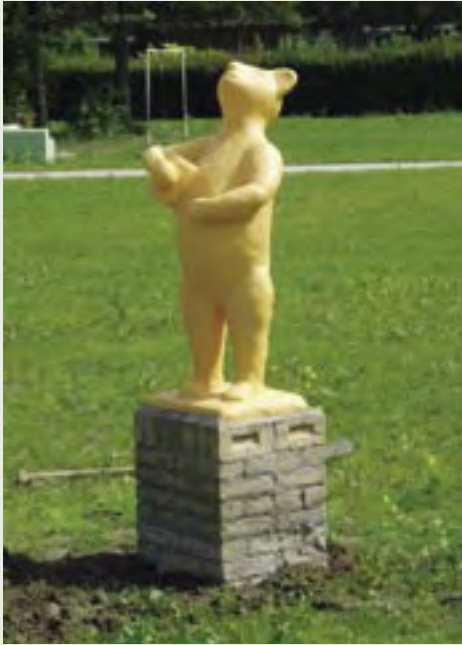
17 | Winnie de Poeh | Onbekend