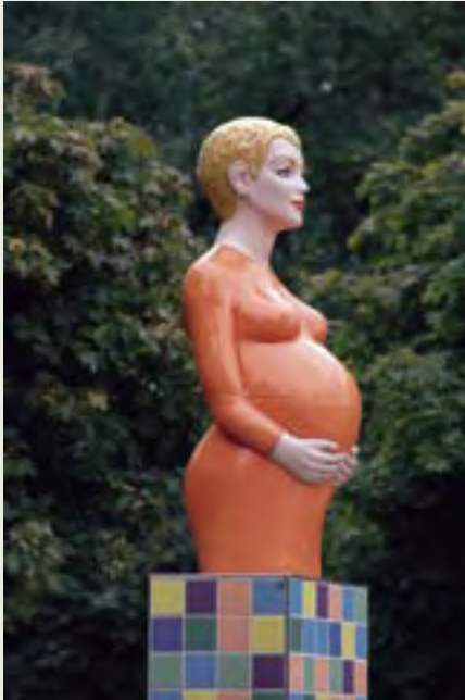
13 | Zwangere vrouw | B. Holslag