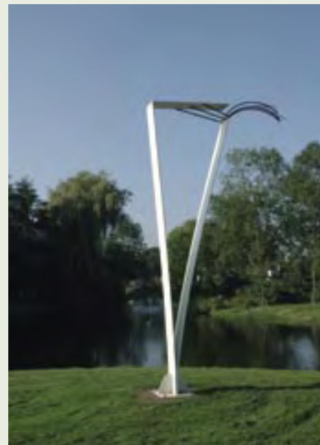
20 | Kunstwerk zonder titel | F. Wolf-Wubben