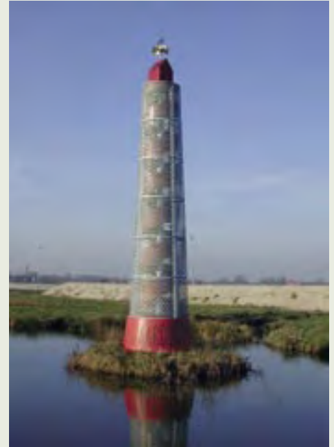
12 | Donjon | N. Dings