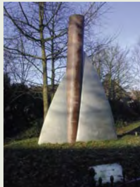
16 Herdenkingsmonument | J. de Baat