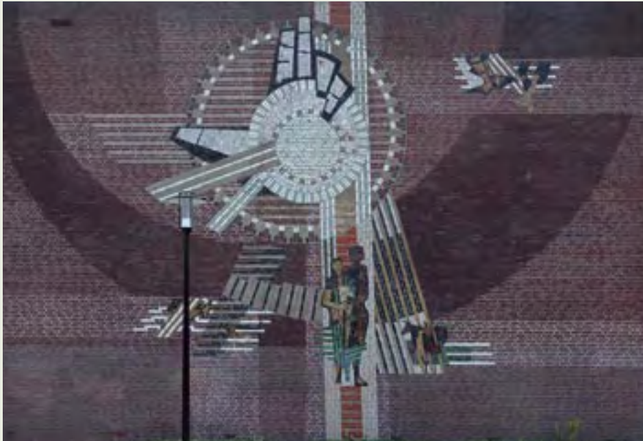
7 | Scheppingsverhaal | R. Karrè