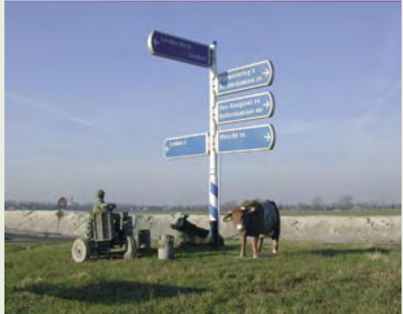
10 | Tractor, Lakenvelder en Groninger Blaarkop | J. Baudoin