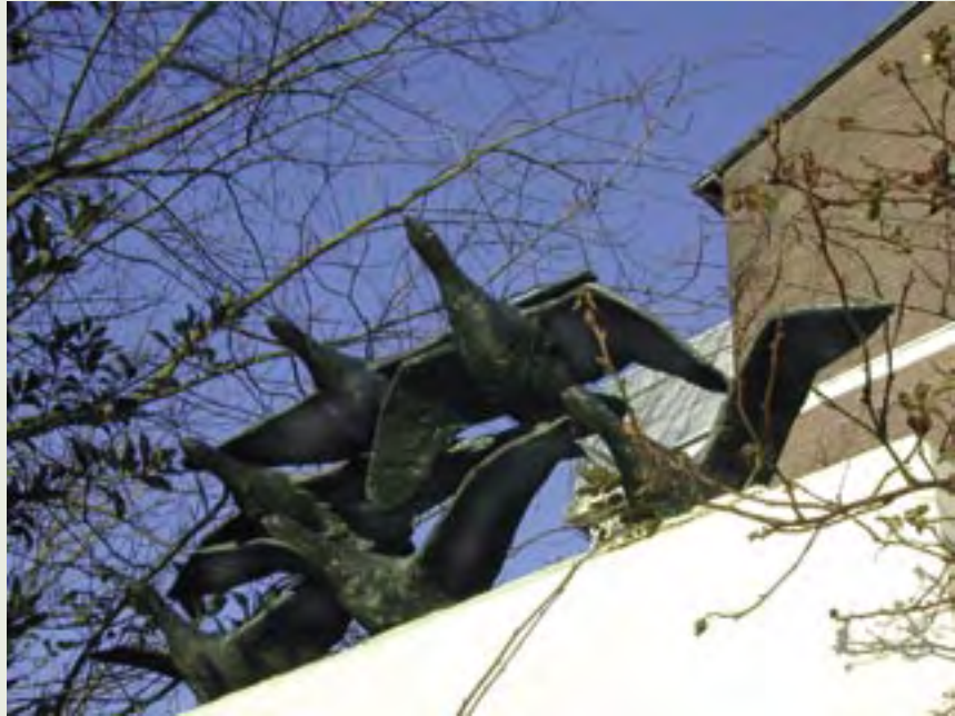
14 | Groep Vogels | L. van Blaaderen