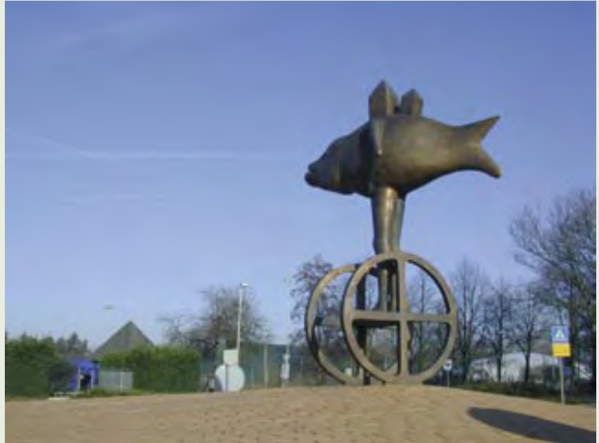
2 | Vis op Wielen | Koopman & Bolink