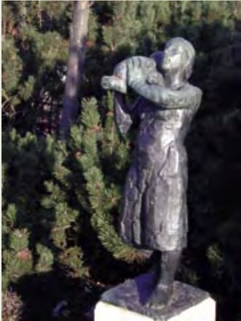
5 | Moeder en kind | F. Letterie