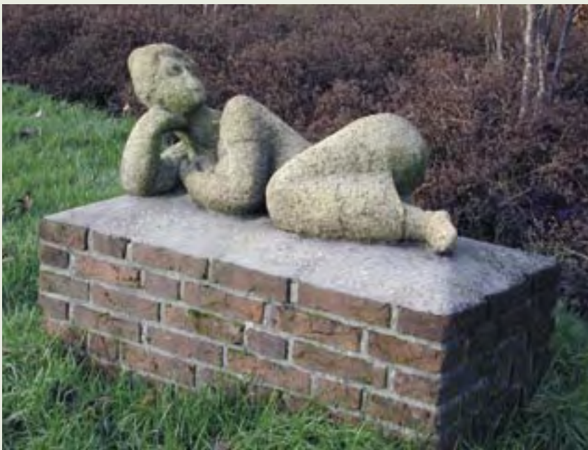
19 | Liggende vrouw | E. Postuma