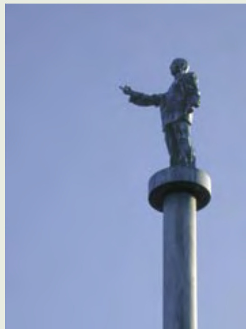
4 | Gnomon | N. Dings