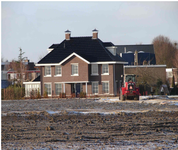
Modelwoning 't Heerlijk Recht

Op 19 november 2005 opende Bohemen de modelwoning in het gebied waar de nieuwe woonwijk 't Heerlijk Recht verrijst. Geïnteresseerden mochten op die dag en kijkje komen nemen. Informatie is opvraagbaar bij Bohemen: 070-386 30 40 en op www.heerlijkrecht.nl .