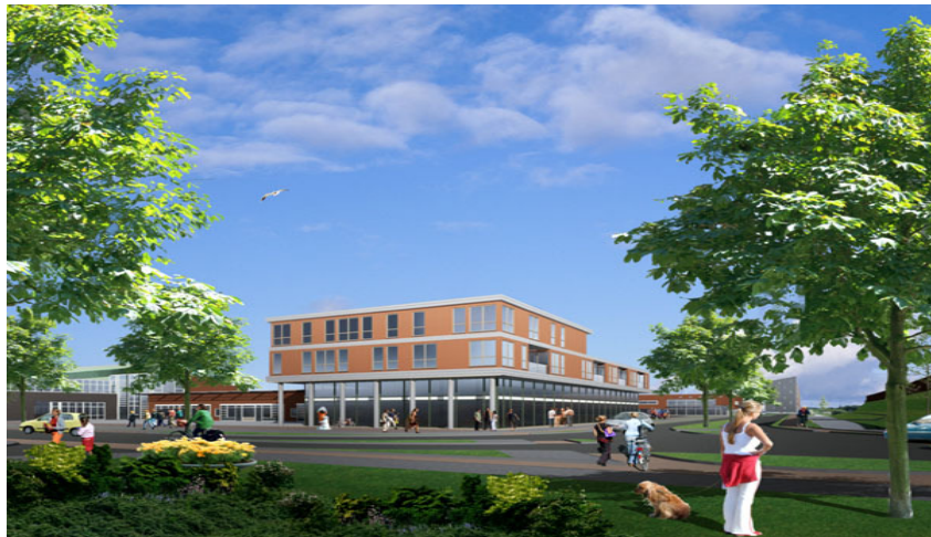
Zwembadlocatie: Brede School, bedrijvenruimte

Deze planning geeft een indicatie van de werkzaamheden. Er kunnen geen rechten aan ontleend worden.