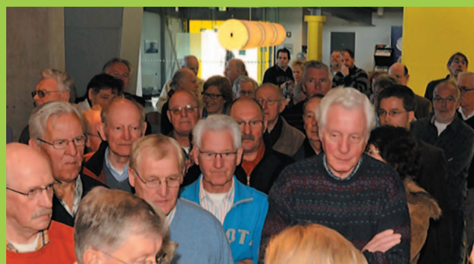
De mensen stonden in de rij om een presentatie te kunnen volgen.

de presentatie op donderdag 20 mei van 14.00 tot 15.30 uur door een e-mail te sturen aan InformatiecentrumA4@rws.nl met de vermelding 'Presentatie bouw aquaducten 20 mei'. Daarna ontvangt u van rijkswaterstaat een bevestiging dat u welkom bent. Als er genoeg animo is dan zal ook in juni nog een presentatie worden gegeven.