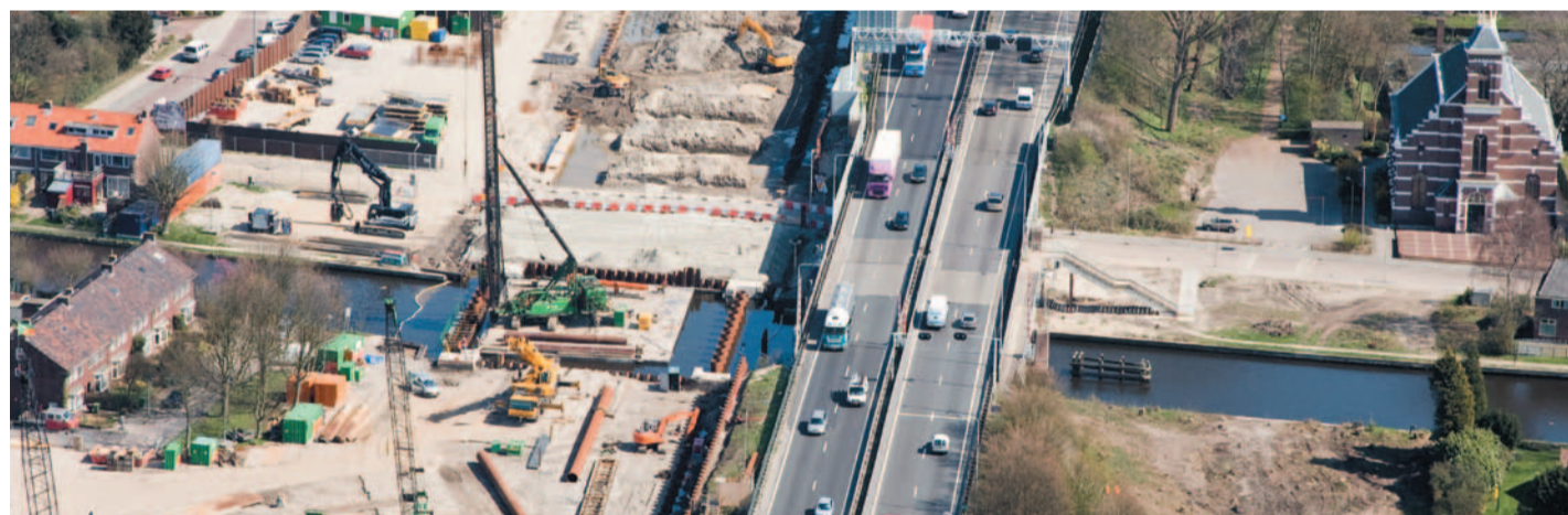
De werkzaamheden rond de Hoge Rijndijk vanuit de lucht gezien

Omdat het landbouwverkeer geen toegang heeft tot de N11 is voor dit verkeer een andere omleidingsroute ingesteld. Deze