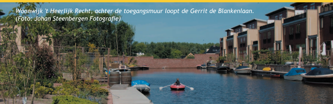
Woonwijk 't Heerlijk Recht, achter de toegangsmuur loopt de Gerrit de Blankenlaan.

VerdeVista Meerburg is een ontwikkellocatie in Zoeterwoude Rijndijk aan de oostzijde van de A4. In VerdeVista Meerburg worden kantoren, bedrijven en woningen ontwikkeld. Langs de A4 komen vooral kantoren en bedrijven als zichtlocatie vanaf de A4. Het wonen richt zich meer op het rustiger achterliggende gebied richting de Meerburgerwatering. Voor meer informatie over de plannen en het laatste nieuws kunt u kijken op www.zoeterwoude.nl of op www.verdevistameerburg.nl .