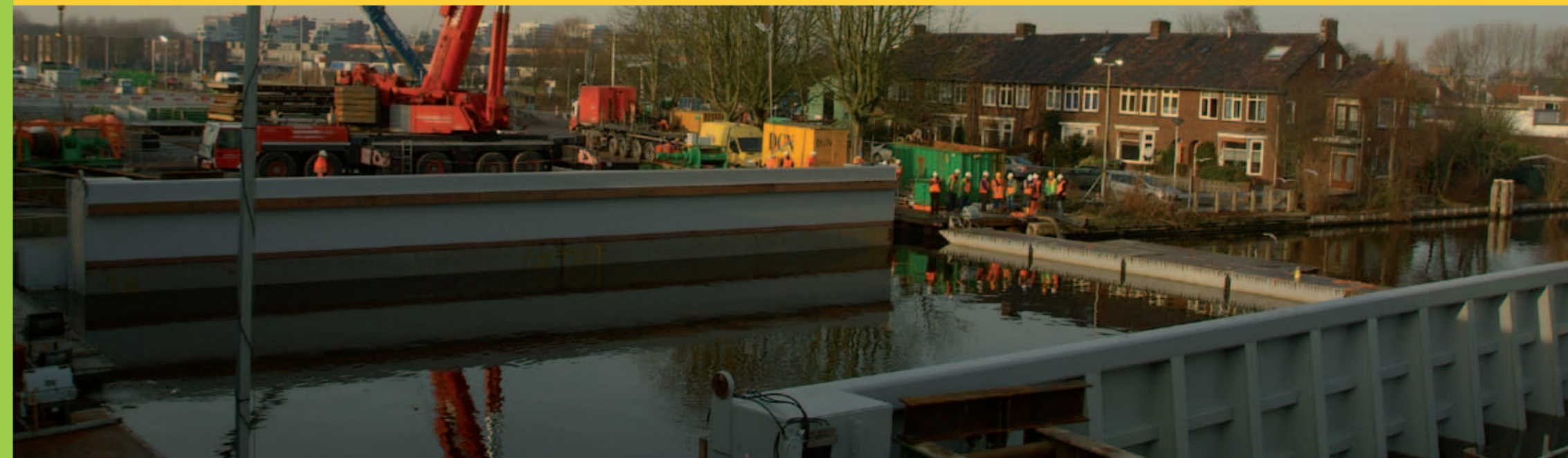
Nadat het beton is uitgehard wordt op 4 januari extra ballast aangebracht. Hierdoor wordt het aquaduct met behulp van de lieren geleidelijk in de Oude Rijn afgelaten en komt het uiteindelijk op de gemaakte damwanden en kessen te rusten.