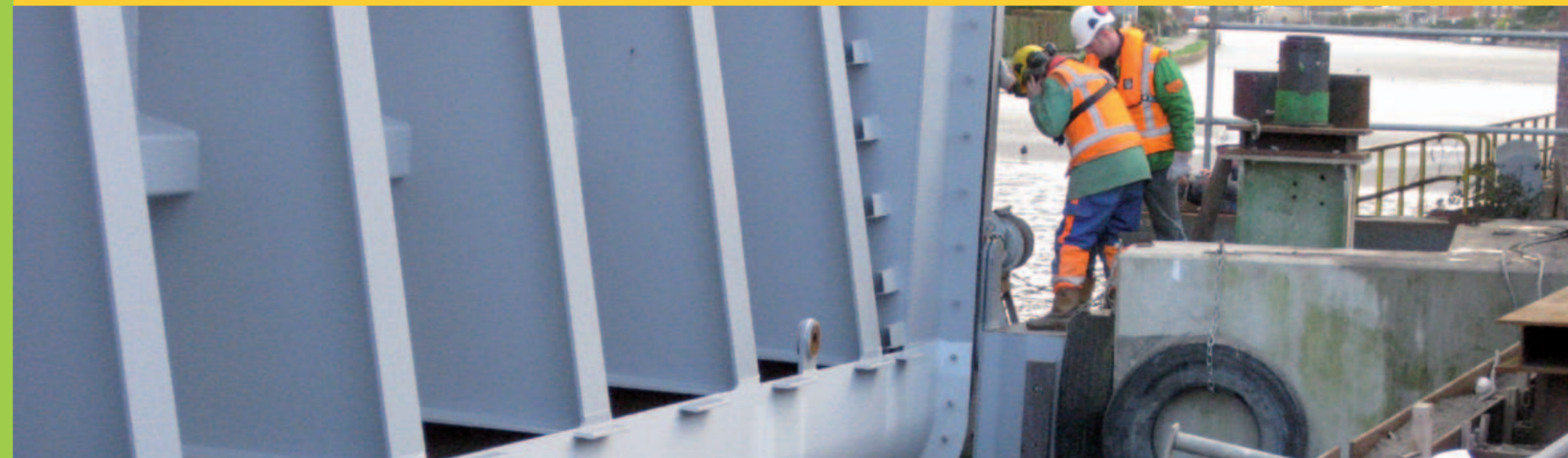
Als de pontons zijn verwijderd, wordt het aquaduct op het water gelegd en blijft drijven.