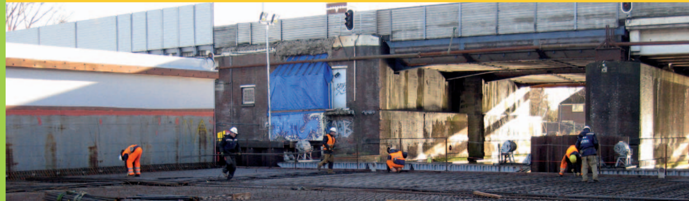
De lieren houden het aquaduct in de juiste positie. Daarna wordt op het aquaduct wapening en een betonvloer aangebracht.