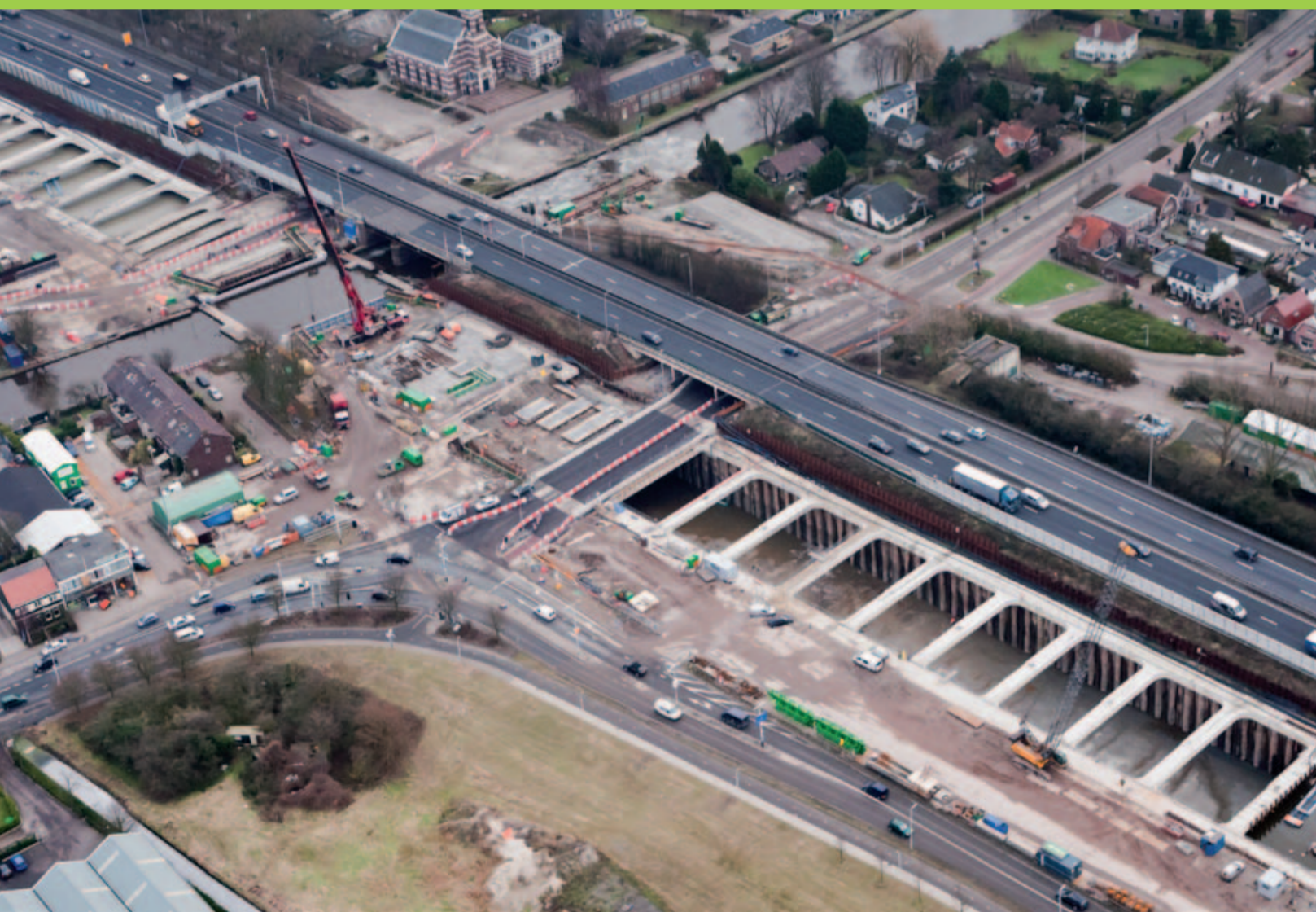
Naast de huidige A4 is de verdiepte ligging in aanbouw. Op de voorgrond de Willem van der Madeweg en de kruising met de Hoge Rijn dijk te Leiden. Vrijwel recht tegenover de kerk aan de Hoofdstraat Leiderdorp komt een ophaalbrug t.b.v. het langzaam verkeer over de Oude Rijn.