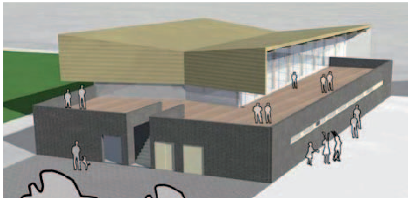
Impressie nieuwe clubhuis sportcomplex Meerburg