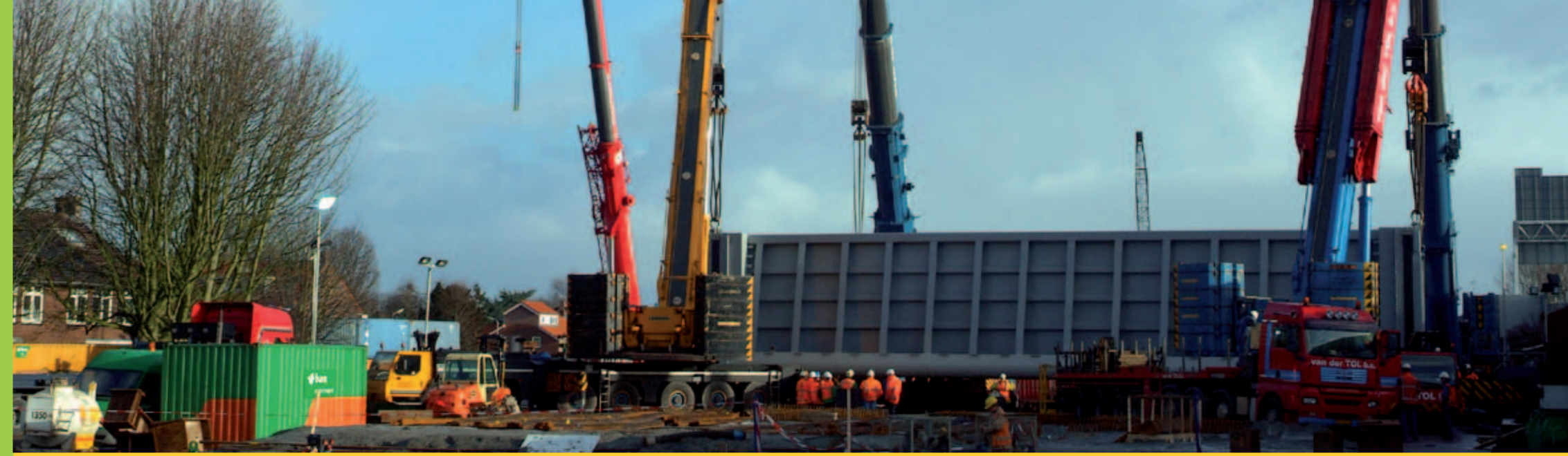
Het aquaduct is van het werkterrein terug geschoven boven de Oude Rijn op pontons. Op 9 december 2010 is het stalen aquaduct (440 ton) door vier grote kraanwagens van de pontons getild.