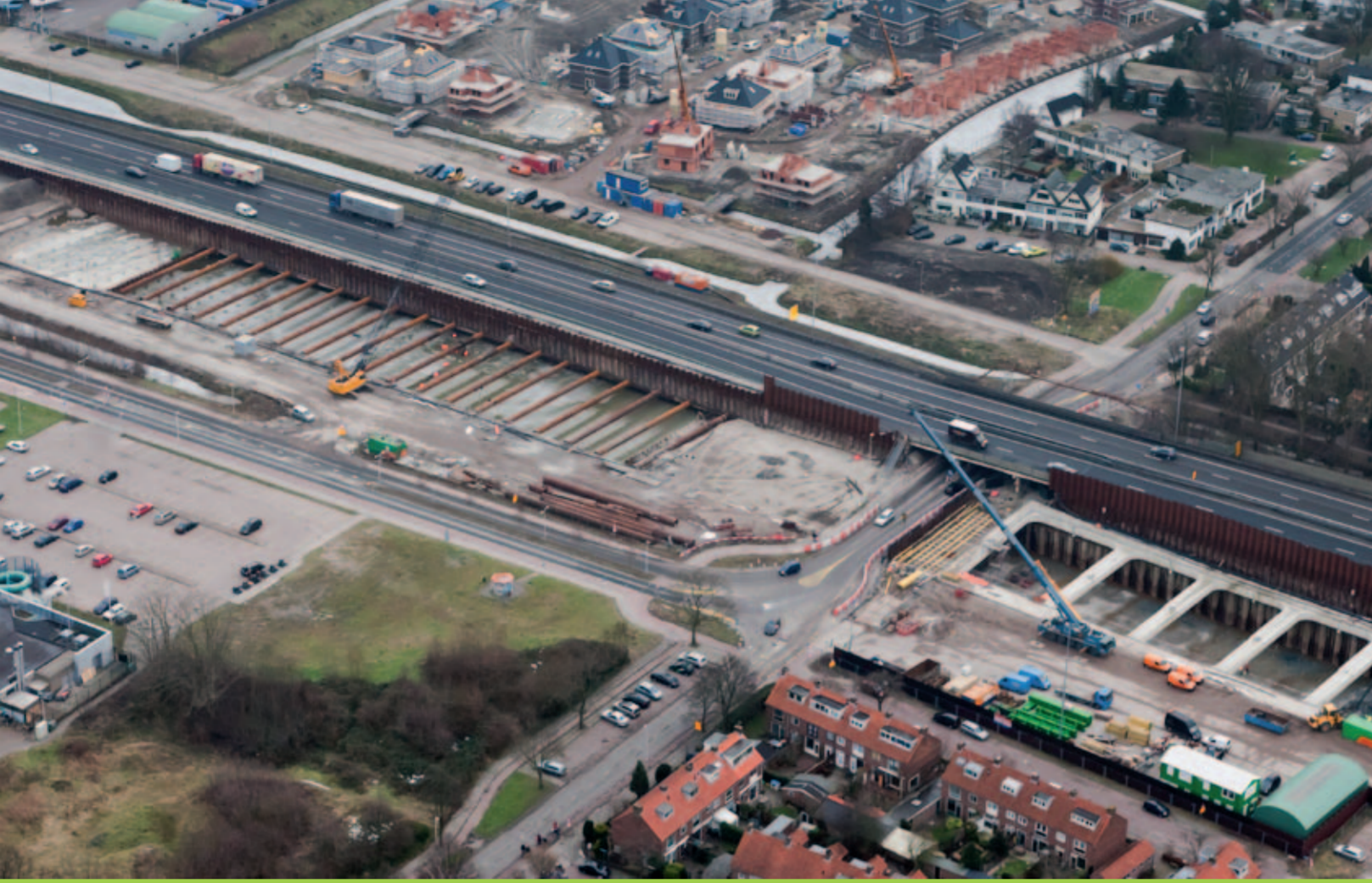
Het viaduct Ericalaan/Mauritsingel, onder de A4 door, gaat verdwijnen. In de nieuwe situatie gaat de Ericalaan/Mauritsingel over de A4 heen. De contouren van de westelijke verdiepte ligging van de A4 zijn goed zichtbaar. Op de voorgrond de woningen aan de Van Geerstraat. Aan de andere kant van de A4 is de bouw van 't Heerlijk Recht in volle gang.