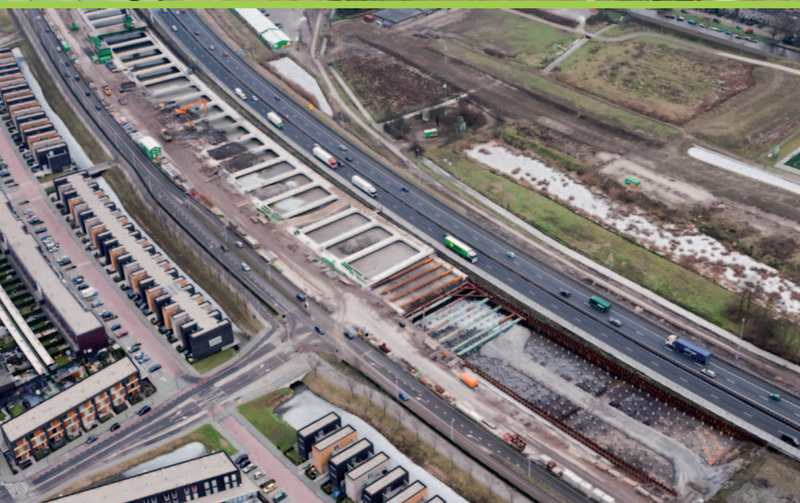
Ter hoogte van Roomburg gaan de werkzaamheden ook voortvarend. Links de Fortunaweg die aansluit op de Willem van der Madeweg. Er komt een nieuwe verbinding tussen Roomburg, over de verdiepte A4, naar de Meerburgerpolder die rechtsboven ligt.