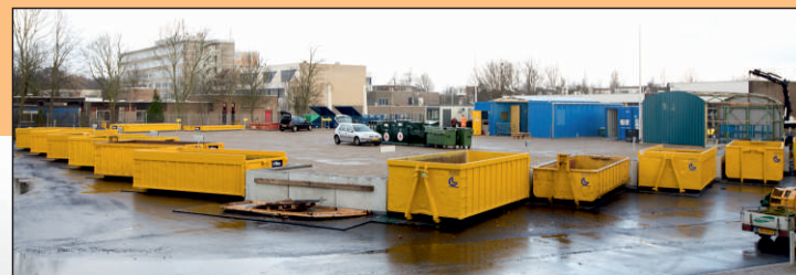
Milieustraat Simon Smitweg 9 2353 GA Leiderdorp

De gemeente Leiderdorp heeft een nieuwe milieustraat ontwikkeld. De oude milieustraat voldeed niet meer aan de eisen die aan een klantvriendelijke brengvoorziening gesteld mogen worden. De nieuwe milieustraat heeft een perron van waaraf het afval op een veilige en makkelijke manier in de containers kan worden gedeponerd. Op de nieuwe milieustraat is het klantenverkeer en bedienend verkeer van elkaar gescheiden, wat de veiligheid ten goede komt. Het aantal fracties waarin het afval kan worden gescheiden is ook fors uitgebreid. Zo kan het hout nu worden opgedeeld in verduurzaamd hout en gewoon hout. Ook voor matrassen en gips zijn er aparte containers, en zullen papier en kunststof in een perscontainer moeten worden gedeponerd. Om u zo goed mogelijk van dienst te kunnen zijn vragen wij u de aanwijzingen van het personeel goed op te volgen, zodat het afval op de juiste manier gescheiden wordt.