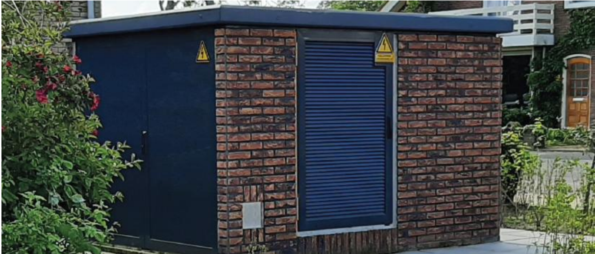
Foto 4: Deze trafo heeft een steenstrip die lijkt op de bakstenen van de omliggende woonhuizen.

dan in een modern winkelgebied. De stedenbouwkundige kijkt naar de omgeving, het kleurgebruik, materiaalgebruik en adviseert Liander welke uitstraling het beste past. In bijzondere gevallen kan een groen dak een van de mogelijkheden zijn: Liander doet proeven met daken van vetplanten (sedum), maar dit zit nog niet standaard in de opties.