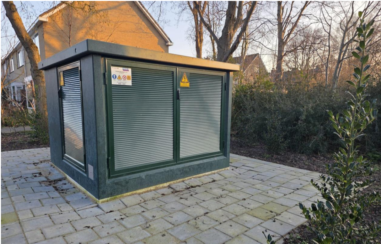
Foto 3: Deze trafo in de Roerdompstraat heeft dezelfde groene kleur als de struiken (hulst) eromheen, zodat deze goed past binnen de omgeving. De gemeente heeft 9 nieuwe struiken geëist op deze locatie ter compensatie van de plaatsing van de trafo.

In een zoekgebied van Liander kijkt Groenbeheer vooral mee of er een locatie is gekozen die ervoor zorgt dat bomen behouden blijven. Ook is het vanuit de gemeente niet wenselijk om een trafo onder een boomkruin te plaatsen, omdat het graafwerk bij het plaatsen van een trafo ernstige beschadiging van boomwortels kan geven. Het kan betekenen dat er wat groen (struiken, kruiden of gras, bijvoorbeeld) ingeleverd moet worden om een trafo bij te bouwen. Groenbeheer schrijft in een beplantingsplan hoe zoveel mogelijk groen kan terugkomen bij de plaatsing van de trafo. Dit beplantingsplan wordt door de gemeente meegegeven aan Liander, en zij zijn daarna verantwoordelijk voor de kosten van de beplanting.