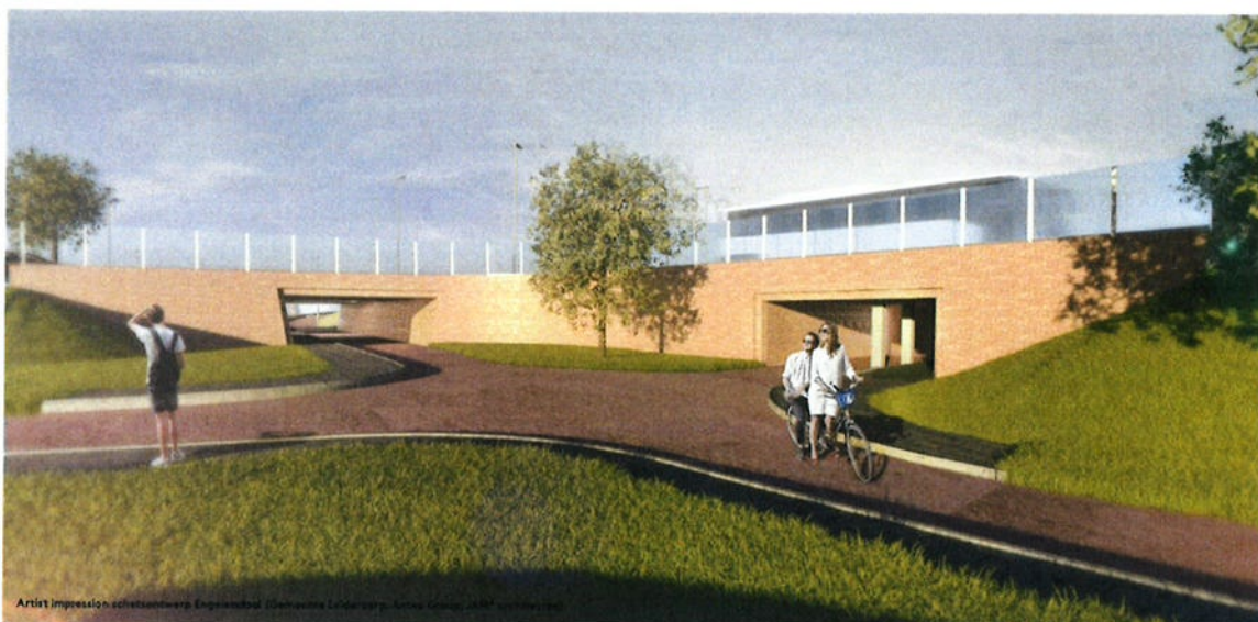
Impressie 1: Nieuwe onderdoorgangen voor fietsers en voetgangers kruising Engelendaal – Oude Spoorbaan