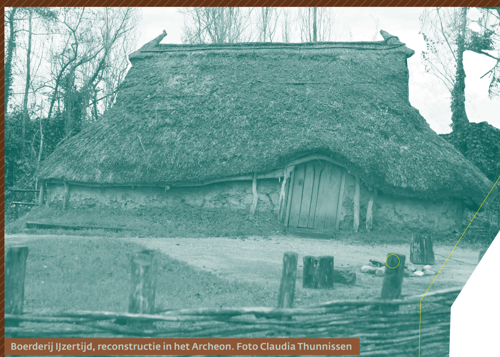
Boerderij IJzertijd, reconstructie in het Archeon.

Hier werd al gewoond in de IJzertijd (800–12 v. Chr.). Verderop stroomde de Rijn, een brede en woeste rivier. Maar hier lagen kleine boerenederzettingen veilig op de hogere en droge oeverwallen. De mensen leefden samen met het vee in woonstallen. Links, in de Huis ter Doespolder, is tijdens het afkleien de stookplaats van zo'n boerderij met bergen as, scherven en huttenleem gevonden. Huttenleem is klei waarmee de bewoners het twijgenvlechtwerk van hun huis bestreken. Er liep een pad van naast elkaar gelegde stammetjes door het veenlandschap, vanaf de nederzetting in uw richting. Rechts, in de polder Achthoven, zijn veel scherven uit de IJzertijd en de Romeinse tijd opgegraven. Enkele grote voorraadpotten zijn hieruit samengesteld. Ze hebben kleine oren, waar je een koord doorheen kunt doen om ze buiten bereik van dieren op te hangen.