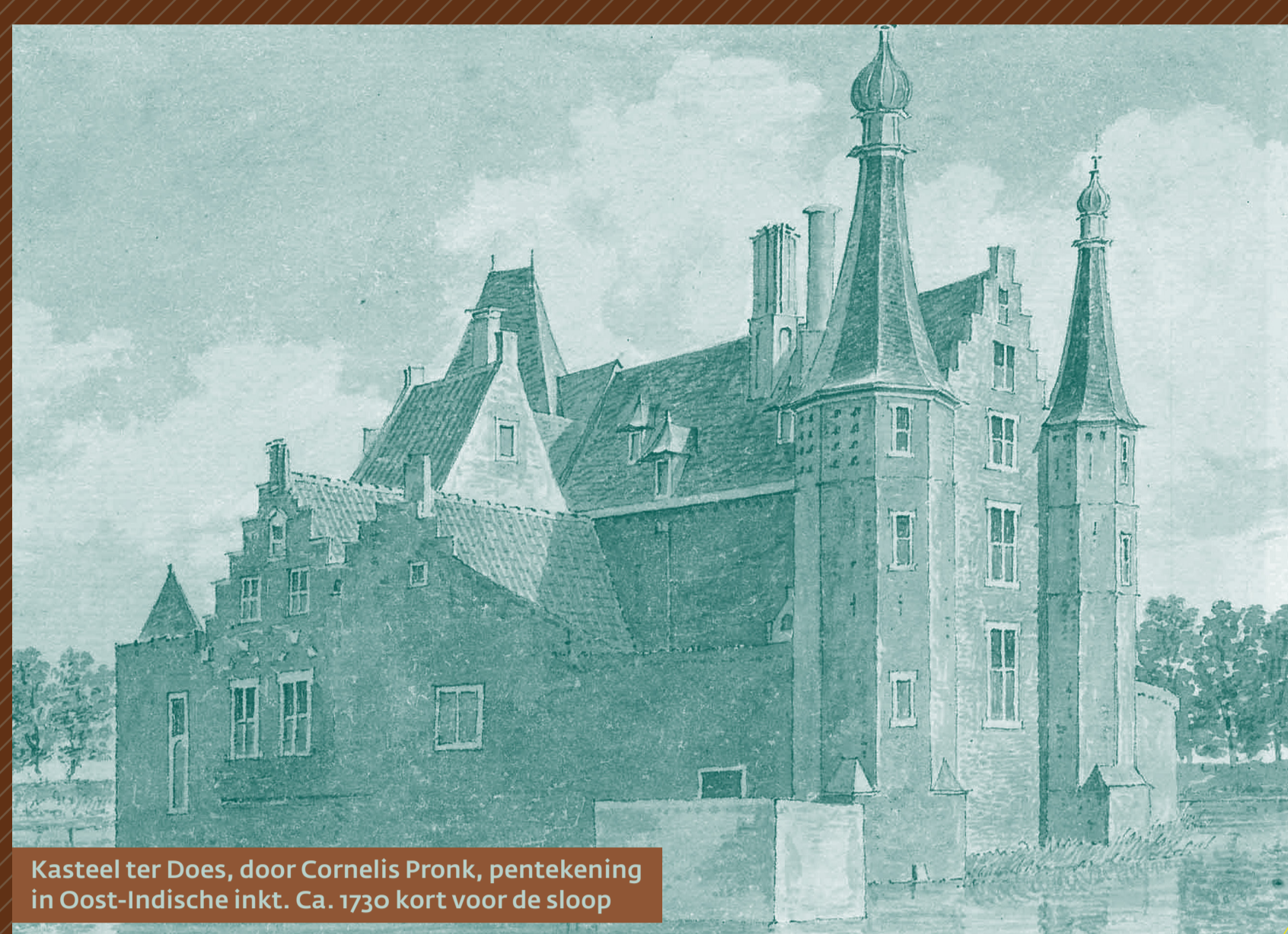
Kasteel ter Does, door Cornelis Pronk, pentakening in Oost-Indische inkt. Ca. 1750 kort voor de sloop

Voor u ligt boerderij Doeshof. De lage bakstenen muur ervoor is het restant van de oude tuinmuur van het middeleeuwse kasteel Ter Does. Het werd kort voor 1300 gebouwd door de adellijke familie Van der Does. Deze had het land in leen van Floris V, graaf van Holland. Ter Does was een van de maar liefst zes kastelen van Leiderdorp. Ze stonden langs de Rijn. Alle zijn weleens belegerd, geplunderd of verwoest. Tijdens de Hoekse en Kabeljauwse twisten streed de Kabeljauwse hertog Jan van Beieren tegen zijn nicht Jacoba van Beieren, gravin van Holland. De Hoekse adel steunde haar. In 1420 brandschatte de hertog hun kastelen rond Leiden. In Koudekerk aan den Rijn veroverde hij kasteel Poelgeest. De Leiderdorpers zagen dat woeste leger langstrekken. Het Hoekse huis Ter Does gaf zich vrijwillig over. Het kasteel werd gespaard vanwege de Kabeljauwse sympathieën van de oudste zoon van de kasteelheer, of omdat de bewoners tijdig beseften dat de ouderwetse ringmuur niet op kon tegen het nieuwe vuurgeschut.