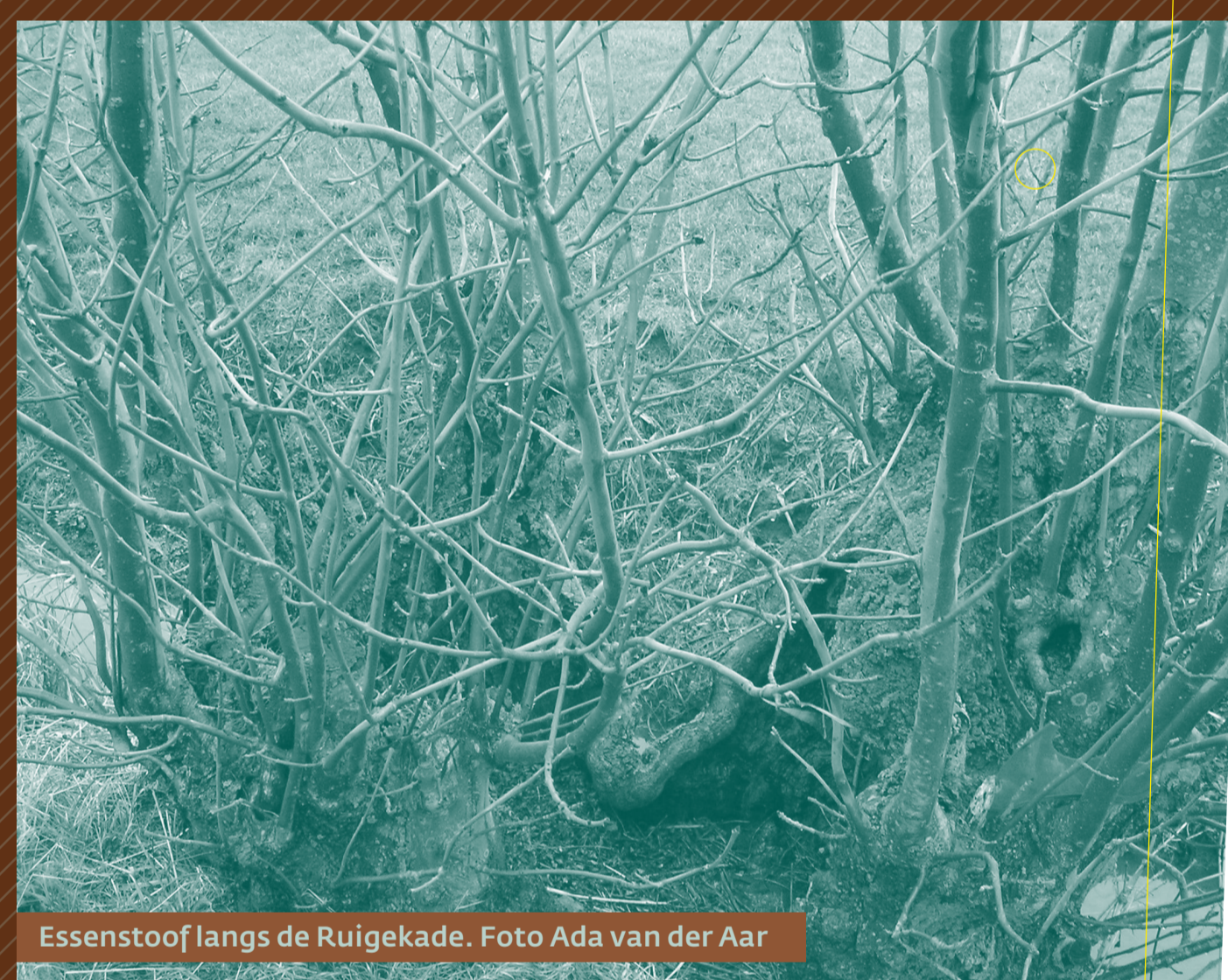
Essenstoof langs de Ruigekade.

Langs dijken en kaden staan vaak essen. De boom is herkenbaar aan zijn zwart fluwelen knoppen, veervormige bladeren en zaden met vleugeltjes. De es kan goed tegen knotten (afzagen). Het taai hout is geschikt voor stelen van spaden en bijlen. Boeren hadden geriefhoutbosjes voor gereedschap, brand- en timmerhout. Sinds de tweede helft van de 20ste eeuw worden de bosjes daar niet meer voor gebruikt. Een es die vroeger regelmatig tot vlak boven de grond werd afgezet (gesnoeid), kreeg daardoor een speciale vorm: een stoof. Er lopen meerdere stammetjes uit. De essenstoof heeft een grillige structuur met allerlei holtes. Essenstoven zijn natuurreservaatjes voor broedende vogels, kikkers, insecten en mossen. Hun wortelstelsel is uitgebreid en houdt de bodem vast. Voor de stevigheid van dijken is dat een voordeel. Langs de Ruigekade vind je zowel stoven van essen als van andere boomsoorten. Ze zijn eeuwenoud!