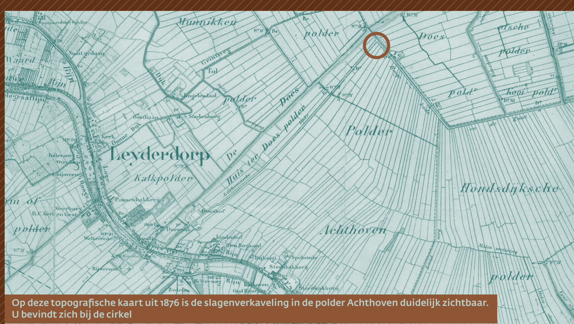
Op deze topografische kaart uit 1876 is de slagenverkaveling in de polder Achthoven duidelijk zichtbaar. U bevindt zich bij de cirkel.

De Ruigekade maakt hier een scherpe knik. De dijk dateert uit de middeleeuwen, toen kolonisten het ruige moerassige land ontgonnen. Ze begonnen aan de kant van de Rijn en groeven parallelle sloten om de grond te ontwateren, waardoor er langgestrekte percelen ontstonden. Aan het eind legden ze een kade aan waarop u nu staat. Zo'n systematische ontginning van smalle stroken land heet een strek- of slagenverkaveling. Je kunt die goed zien vanaf de kade. De naam Ruigekade staat op de oudste kaarten.