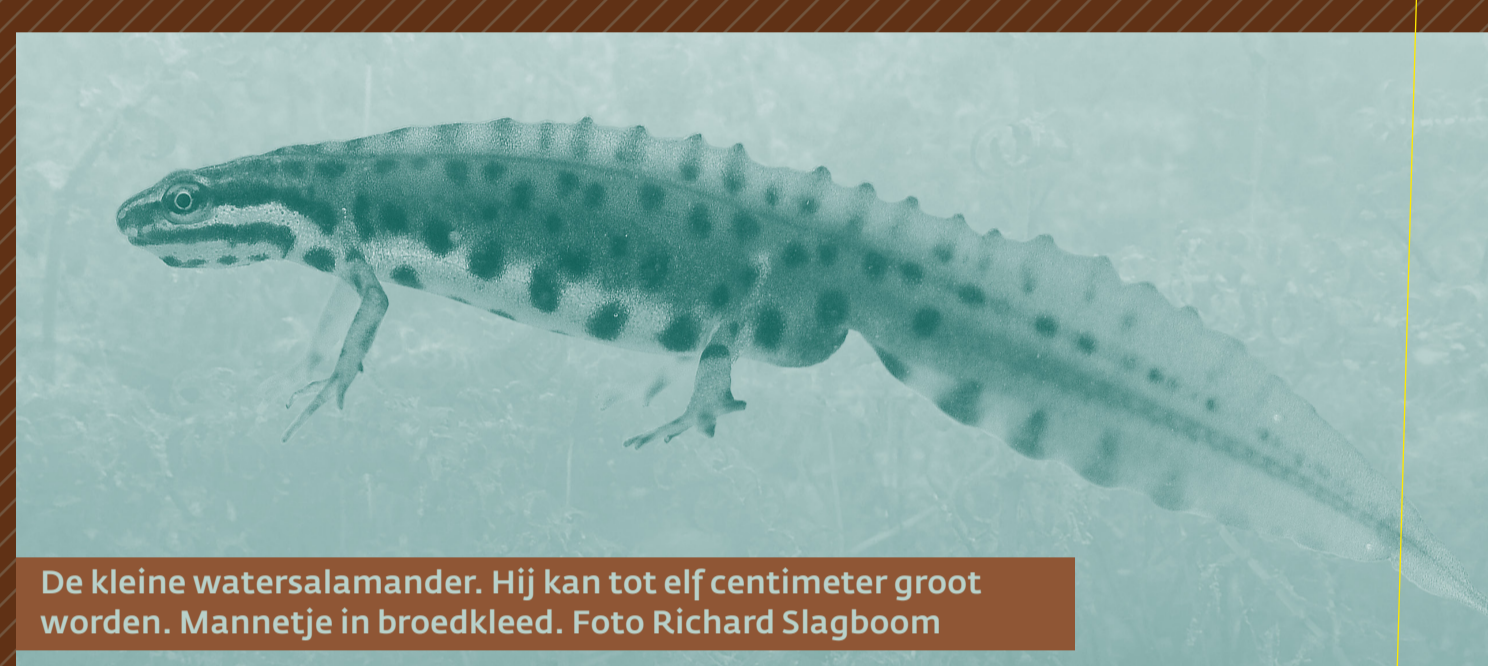
De kleine watersalamander. Hij kan tot elf centimeter groot worden. Mantjeje in broedkleed.

In het verleden gingen de biologiestudenten van de Leidse universiteit op eerstejaarsexcursie langs de Ruigekade. Die bood een fraai flora- en fauna-overzicht van de Nederlandse polders. Hierover vertelt bioloog schrijver Maarten 't Hart smakelijk in het verhaal 'De Waterstaafwants' (1981). Ieder jaar vangen ze 'zo goed als alles .. wat maar in een sloot kan leven.' De bioloog raakt geobsedeerd door een mooie studente. Met haar ziet hij de waterstaafwants, een droom! Dat beestje hoopt hij al jaren hier te vinden. Nog steeds is dit hoekje van de Ruigekade een paradijsje van biodiversiteit.